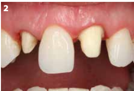
Fig. 2: Denti preparati secondo le linee guida per i restauri in ceramica.

e stabile nel lungo periodo. I denti sono stati preparati di tenendo conto di questi criteri. (Fig. 2).