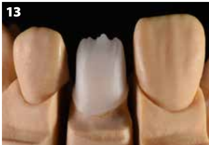
Fig. 13: Ingrandimento vestibolare della cappetta sul dente 21

L'esperienza ci mostra che il bordo ridotto si adatta bene al tessuto mole e garantisce un livello elevato di stabilità dal punto di vista della tecnica dei materiali.