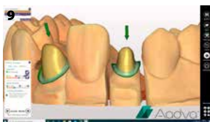
Fig. 9: Determinazione della direzione di inserimento