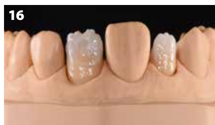
Fig. 16: Interazione tra aree concave e convesse per riprodurre profondità e tridimensionalità

conferiscono al framework in ossido di zirconio la sua fluorescenza naturale. Al contempo, essi aggiungono cromia e profondità e pertanto formano la base per la successiva stratificazione della ceramica individuale. La profondità del colore desiderata è stata inoltre amplificata dalla differenza di struttura delle polveri ad elevata cromaticità INside Zr-FS applicate sulle cappette cotte con le Lustre Pastes (Fig. 16). Applicando uno strato di INside 41 (IN-41 Flamingo), si è ottenuta una struttura incisale dall'aspetto naturale. I materiali sono stati stratificati nelle aree dentinali preparate sia concave che convesse, creando un effetto ondulato dovuto alla loro interazione. Si è utilizzato uno strato intermedio con "materiali CLF" per rinforzare la tridimensionalità e l'effetto di profondità, simile al cosiddetto strato proteico tra la dentina e lo smalto incisale presente sui denti naturali. La massa incisale per realizzare l'ultimo