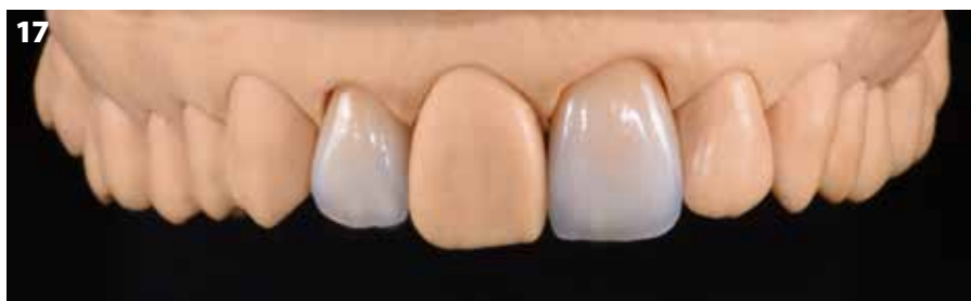
Fig. 17: Le corone rivestite e finite hanno un aspetto estremamente naturale ed evidenziano un'interazione vivace tra i colori.

Ceramiche e soluzioni digitali da una singola fonte: dove le tecniche manuali e quelle automatizzate procedono di pari passo