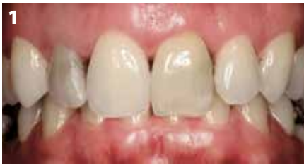
Fig. 1: Situazione iniziale. Gli elementi 12 e 21 sono da ricostruire.