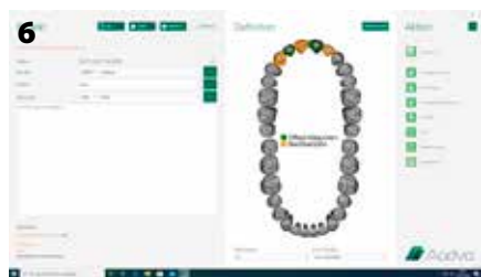
Fig. 6: Compilazione del modulo d'ordine nel software di Aadva Lab Scan