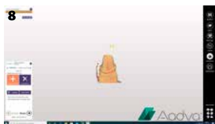
Fig. 8: Definizione dei margini della preparazione (linee di finitura)