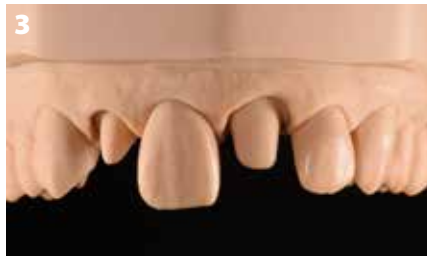
Fig. 3: Il modello con i monconi preparati. a) Proiezione vestibolare; b) Proiezione obliqua

Mentre lo scanner è in grado di catturare quasi tutte le geometrie rientranti nel range visivo, le aree della preparazione che sono complesse dal punto di vista della tecnologia di fresatura sono difficili da visualizzare. In presenza di geometrie inadatte, a volte il software non riesce a catturare correttamente le forme. Le conseguenze sono tempi lunghi per la post-elaborazione e complessi adattamenti all'impalcatura. Per quanto riguarda il design del framework, è inoltre necessario tenere in considerazione i requisiti fondamentali, ad esempio lo spessore minimo, che spesso sono già memorizzati nel software CAD. Se si rispettano