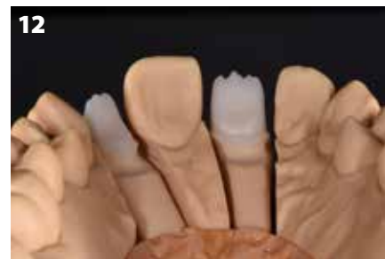
Fig. 12: Cappetta in ossido di zirconio con profilo a ghirlanda inserita sul modello

Grazie all'elevata precisione dello scanner e al fatto che i framework sono stati costruiti da un centro di fresaggio esperto, le cappette dei framework sono state inserite sul modello master con poca fatica. Eseguendo l'adattamento sotto un microscopio stereo, si possono eliminare con precisione tutti gli eventuali contatti precoci. Per essere delicati sul materiale, le cappette sono state lavorate con strumenti rotanti adeguati e sotto getto d'acqua per raffreddare l'area. In questo caso specifico, le cappette sono state progettate con un bordo in ossido di zirconio (a ghirlanda) nell'area palatale (Fig. 12).