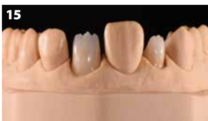
Fig. 15: Cottura wash con le Initial Lustre Pastes

Prima di questa fase, è stata eseguita una cottura wash con le Initial Lustre Pastes (Fig. 15). I composti colorati