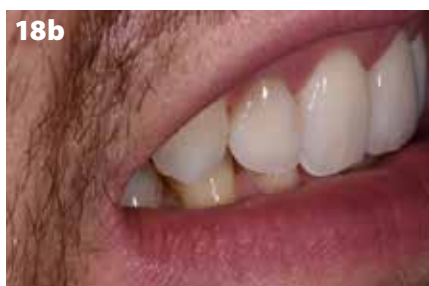
Fig. 18: L'integrazione in bocca. Le corone in ceramica integrale sugli elementi 12 e 21 si integrano in modo naturale e impercettibile con i denti naturali; a) Proiezione frontale; b) Proiezione obliqua.