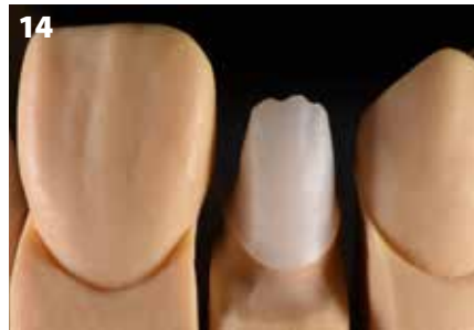
Fig. 14: Ingrandimento vestibolare della cappetta sul dente 12; l'adattamento dei margini è quasi perfetto.

conferiscono al framework in ossido di zirconio la sua fluorescenza naturale. Al contempo, essi aggiungono cromia e profondità e pertanto formano la base per la successiva stratificazione della ceramica individuale. La profondità del colore desiderata è stata inoltre amplificata dalla differenza di struttura delle polveri ad elevata cromaticità INside Zr-FS applicate sulle cappette cotte con le Lustre Pastes (Fig. 16). Applicando uno strato di INside 41 (IN-41 Flamingo), si è ottenuta una struttura incisale dall'aspetto naturale. I materiali sono stati stratificati nelle aree dentinali preparate sia concave che convesse, creando un effetto ondulato dovuto alla loro interazione. Si è utilizzato uno strato intermedio con "materiali CLF" per rinforzare la tridimensionalità e l'effetto di profondità, simile al cosiddetto strato proteico tra la dentina e lo smalto incisale presente sui denti naturali. La massa incisale per realizzare l'ultimo