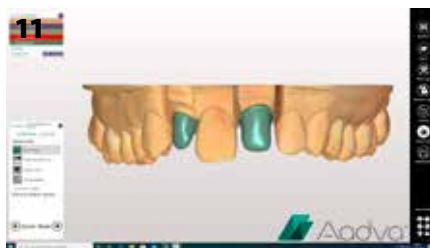
Fig. 11: Il framework in zirconia costruiti

l'utente può liberamente decidere se seguire o modificare questa sequenza secondo le esigenze del singolo caso.