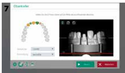
Fig. 7: Allineamento automatico dell'asse Z