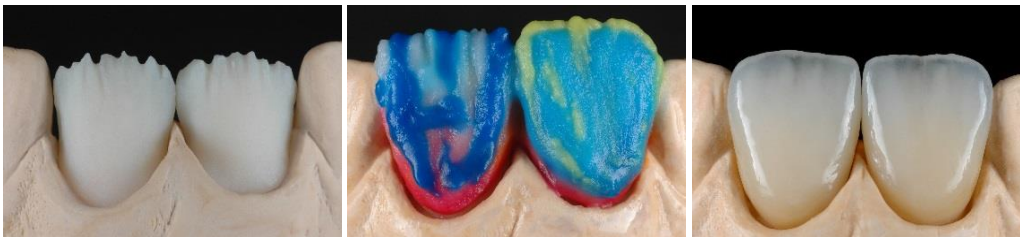
Arbeit und Fotos Michael Brüsch